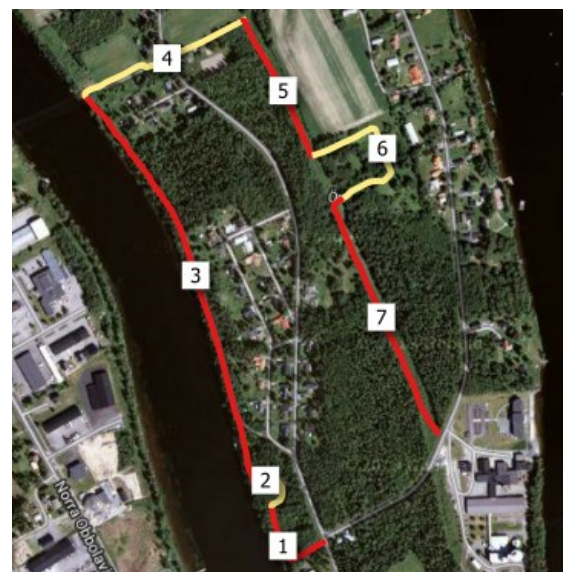
Figur 4. En slinga med 7 segment (Örn, Umeå)

Svensk Dagfjärilsövervakning, Lars Pettersson, Ekologihuset, 223 62 Lund