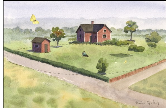
Figur 2. Inventering av punkt.

Det första att tänka på är om du vill gå en slinga eller ha en punkt. En slinga är normalt 0,5-3 km lång och täcker in olika naturtyper och livsmiljöer för fjärilar. Ingen del av slingan ligger närmare än 50 m från en annan del av samma slinga. Slingan delas in i ett antal segment utifrån de naturtyper du vandrar igenom, t ex betesmark, lövskog, kärr. Du inventerar slingan genom att i lugn promenadtakt räkna de fjärilar du ser framför dig, dels 2,5 m åt vardera sidan, dels 5 m framåt, dels 5 m uppåt (se Figur 1). Arter och deras antal noteras för varje segment och inventeringstillfälle. Om en fjäril behöver studeras närmare för artbestämning avbryter man vandringen tillfälligt och fortsätter sedan igen från samma plats. Det är bra om slingan inte är alltför otillgänglig eller alltför arbetsam att inventera. Målet är att följa fjärilarnas antal över ett antal år så lägg upp slingan för en lagom arbetsinsats.